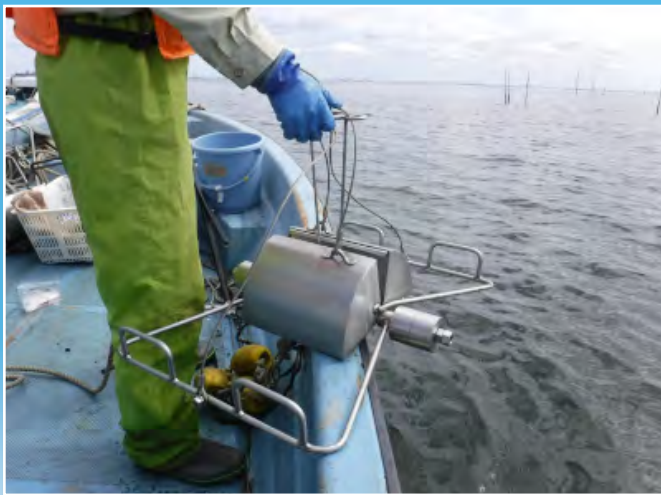
スタンダードタイプ