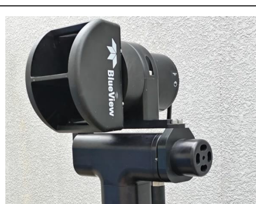
水中3Dスキャナ （Teledyne Blueview BV5000）